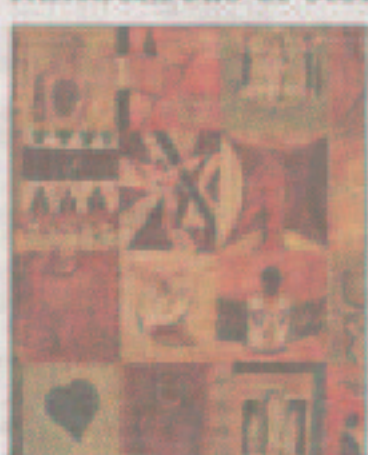
Franck Thierry: Olie på lærred Format: 50 x 60 Kr. 3.800

Franck er en af vores første udstillere, han er meget produktiv og hans kundekreds er stor.