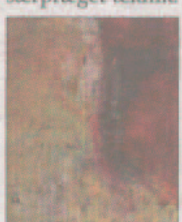
Claus H. Olsen: Akryl på lærred Format: 60x60 Kr. 3.100

Claus H. Olsen: Har malet i ca. 12 år. Vi syntes, at han har et stort talent og mener, at han vil komme til at markere sig i fremtiden, med sin gode farvesans og særpræget teknik.