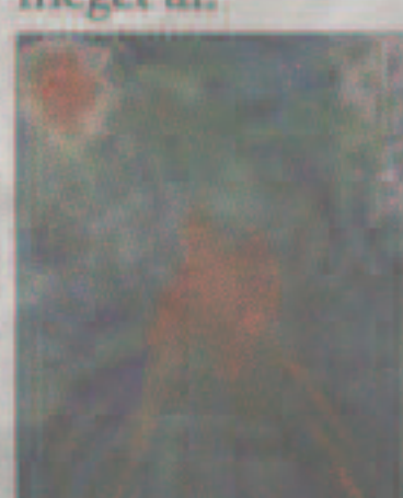
Jeannie Haugegaard: Fuglekvinde Olie på lærred Format: 90 x125 Kr. 6.000

Det er en kunstner, vi venter os meget af.